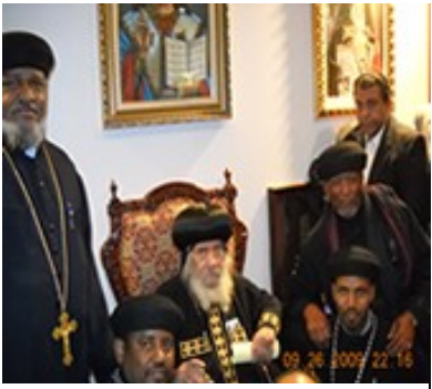
ልኡኽ ሃገረ-ሰብከት ሰሜን ኣሜሪካ ምስ ፖፕ ሺኖዳ

ዘይብሉምን ገሊጾም። ኣስዒቦም፣ ፓትርያርክ ኣቡነ ኣንጦንዮስ ዘወሰድዎ መንገዲ ሓዋርያዊ ስለዘኾነ ኦሪገናል ኣብያተ ክርስቲያናት ኣብ ቅዳሴ ብጸሎት ወትሩ ይዘክርኦም ከምዘለዎ ኣብ ናይ ቅድስና መዓርግ ብተግባር ዘበቐዎ ኣቦ ምዃናም ፖፕ ሺኖዳ ገሊጾም።