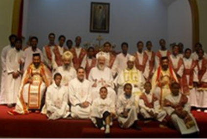
ብጸሎተ ንኹሎም ፓትርያርካት ኪዘክር እንከሎ ንፓትርያርክ ኤርትራ ብጹዕ ወቅዱስ ግን

እዚ ንራብዓይ ጊዜ ብናይ ኩለን ናይ ኦሪገናል ኣብያተ ክርስቲያናት ዝካየድ ዓመታዊ ጉባኤ