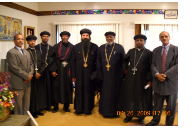
ልኡኽ ሃገረ-ሰብከት ሰሜን ኣሜሪካ ምስ ብጽኦ ኣቡነ ዳዊት

ኣብ ድሮ በዓል መስቀል ማለት ብ26 መስከረም 2009 (፲፯ መስከረም ፳፻፪ ዓ.ም ግእዝ) ምስ ፖፕ ሺኖዳ 3ይ ሊቀ ጳጳሳት ቤተክርስቲያን ምስሪ ተራኺቡ ተዘራረቡ። ኣብቲ ርክብ፤ ኣብ መንፈሳዊ ክልተኣን ኣሓት ኣብያተ ክርስቲያን ዘተኮረ ዝርርብ ድሕሪ ምልዛዖም፤ ኣብ ህሉው ኩነታት ኦርቶዶክሳዊት ተዋሕዶ ቤተ ክርስቲያን ኤርትራ ከምኡ’ውን ብዛዕባ ኩነታት ብፁዕ ወቅዱስ ኣቡነ እንጦንዮስ ፓትርያርክ ተዋሕዶ ቤተ ክርስቲያን-ኤርትራ ዕውቕ ዝበለ ልዝብ ኣካይደም።