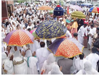
መበል 11 ዓመታዊ ጉባኤ ሃገረ ሰብከት ሰሜን ኣሜሪካ

ኣብ ቀራና ጎደናታት ደው ኢልኩም ተመልከቱ፡ እቲ ጥንታዊ መገድታትን እቲ ጸቡቕ ጎደናን ኣየናይ ምኃኑ ሕተቱ እሞ ብኣኡ ተመለሱ። ሸዑ ንነፍሱም ዕረፍቲ ክትረኽቡ ኢኹም” (ኤር 6፡16) ኣብ ትሕቲ ዝብል መሪሕ ጠቕሲ ዝተኸይደ መንፈሳዊ ጉባኤ፡ ካብ ትጽቢት ዝተገብረሉ ንላዕሊ ወጻኢ ብዝኒ ምእመናንን ዝተሳተፉም፡ ብትሕዝቶኡ ሃብታምን መነቓቓሕን ነይሩ። እዚ ካብ ብዙጋት ክፍለ ሃገራት ኣመሪካ፡ ኤውሮጳን ኣፍሪቃን ብዝመጹ ኣጋይሽ ተጋቢኡ ዝቐነየ፡ ቤተ ክርስቲያን ኦርቶዶክስ