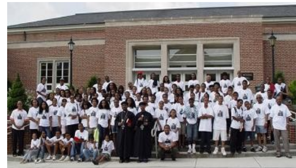
ካልኣይ ዓመታዊ ጉባኤ መንእሰያት ቤተ ክርስቲያን ተዋሕዶ ምብራቕዊ ዞባ ሰሜን ኣሜሪካ።

ካልኣይ ዓመታዊ ጉባኤ መንእሰያት ተዋሕዶ ቤተ ክርስቲያን ምብራቕዊ ዞባ ሰሜን ኣሜሪካ፤ ካብ 25 ክሳብ 27 ሰነ 2009 ዓ.ም ኣብ ከተማ ራድድርድ ክፍለ-ግዝኣት ቪርጂንያ ተኸይዱ። ብተመሳሳሊ መንገዲ ድማ ኣብ ምዕራባዊ ዞባ ሰሜን ኣሜሪካ ካብ ሓምለ 01 ክሳብ 04/2009 ኣብ ከተማ ፖርትላንድ ክፍለ ግዝኣት ኦሪጎን ብኣዘዩ ውዕውዕን ጎውነታውን መንፈስ ተኸይዱ። ዓላማ ጉባኤ ብሓደ ወገን መንእሰያት ውሉድ ኣምላኽ ኮይኖም ንክዓብዩን ፍርሃት-ኣምላኽ ዘለዎ ወለዶ ንምፍራይን ክኸውን ከሎ፤ ቦቲ ካልእ መዳዩ ድማ፡ ቃል እግዚአብሔር ኣብ መንእሰያት ብምሥራጽ