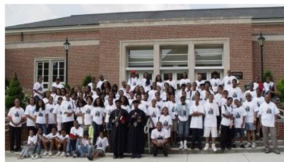
ካልኣይ ዓመታዊ ጉባኤ መንእሰያት ቤተ ክርስቲያን ተዋሕዶ ምብራቓዊ ዞባ ሰሜን ኣሜሪካ።

እዚ ማለት ግን ንሰብ ብቐዳምነት ዘድልዮ እንገራ ምዃኑ ንምምልካት ደለዎበር፡ እቲ ንሰብ ዘድልዮ ሓልዮትን ክንክንን ብእንገራ ጥራይ ይውዳእ'ዩ ማለት ኣይኮነን። ከመይ'ሲ እቲ ኣካላዊ ናይ ዕቤት መሥርሕ፡ ብዙሕን ነዊሕን ካብ ምዃኑ ዝተላዕለ፡