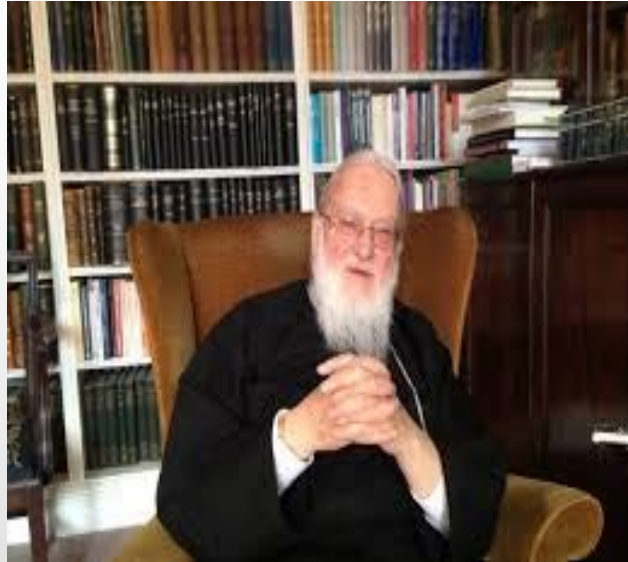
ጳጳስ ካሊስቶስ ዌር ኣብቲ ፍሉጥ ዝኾነ “መገዲ ኦርቶዶክስ ( The Orthodox Way )” ዝብል መጽሓፍ ስምዒ ኢሎም ይገልጹዎ።

“ንሕና (ከም ክርስቲያናት) ብውሽጢ ልብና ኣብ ጉዕዞ/መገሻ ዘሎና ህዝቢ ኢና። እዚ ጉዕዞና ድማ ኣብ ኢድና ብእንኣስሮ ሰዓታት፥ ወይ ብመዓልትታት ናይ ዓውደ ኣዋርሕ ዝዕቀን ኣይኮነን። እዚ መገሻና/ጉዕዞና ካብ መዐቂኒ ጊዜ ወጺእካ ንዘለኣልምነት ዝወስደና መገሻ እዩ” ብማለት ይገልጹዎ።